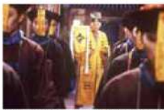
© 2010 Fortune Star Media Limited. All Rights Reserved.

監督:リック・オウ (劉觀偉) 出演:ラム・チェンイン、リック・オウ、ムーン・ロー Director:Ricky Lau Cast:Lam Ching-Ying, Ricky Hui, Moon Lee