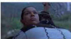
© NoGreen Cinema, Matarozza Producciones, Fondo para la Producción Cinematográfica de Calidad (FoncoCine), La Pace, Afe France Cinema

都会から田舎に越した若い夫婦の体験を、形而上的な視点でスケッチした野心作。鬼才レイダス独特の美学で貫かれた本作は、時空を超えた構成や一見難解なメタファーに溢れ、突然としたカンヌ映画祭の観客の間で激しい賛否両論を巻き起こし、見事に監督賞を受賞した!!