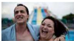
© Fandango - Antimedia - Le Pacte Garantie Capital

TV番組の「リアリティー・ショー」に出演する事にとりつかれ、自分の中の現実がずれていってしまう男を描くブラック・コメディ。「コモラ」でイタリア社会を赤裸々に描いたガローネ監督は、真話の要素を加えつつ本作でも見事に現代を切り取り、カンヌ映画祭グランプリを受賞。