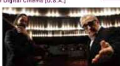
© 2012 Company Films, LLC 配給:アップリンク

キヌ・リーブスが企画製作しナビゲーターを務める。デジタルシネマの現在と未来を探るドキュメンタリー。スコセッシ、ルーカス、キャメロン、フィンチャー、リッチ、ノーラン、ゾダーバーグがキヌとの質問に答える。